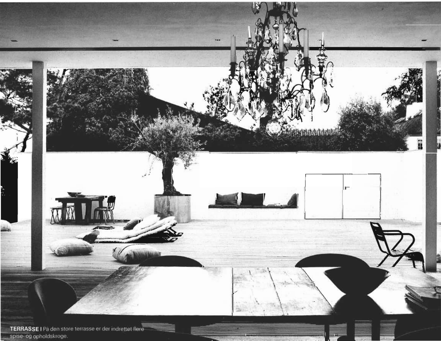
TERRASSE | På den store terrasse er der indrettet flere spise- og opholdskroge.

– Det er jo helt klart udsigten over havet og himlen, som hele tiden forandrer sig. ■